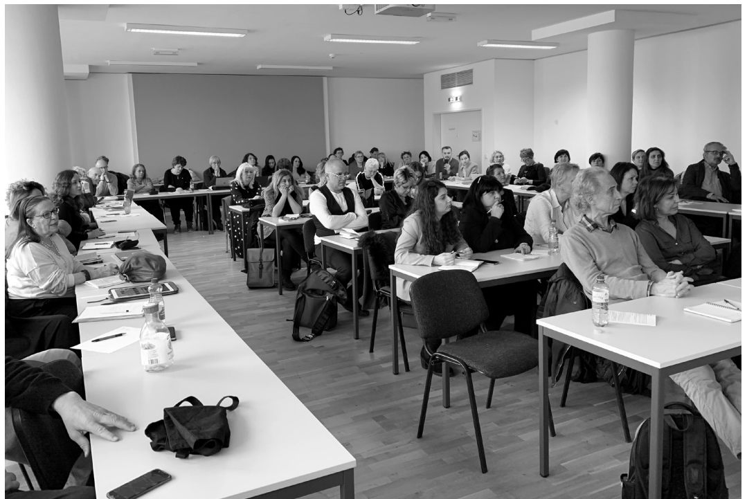
Séance plénière des participants